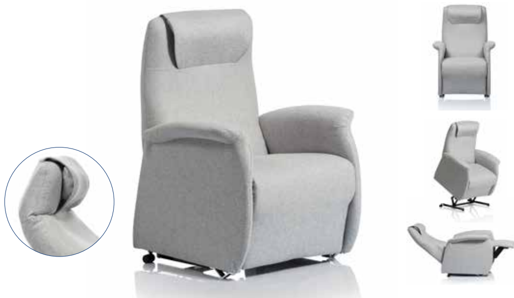
Modèle présenté : Tissu Nika nuage