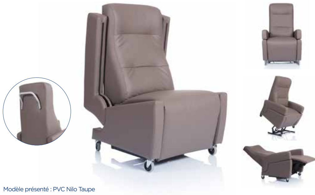
Modèle présenté : PVC Nilo Taupe