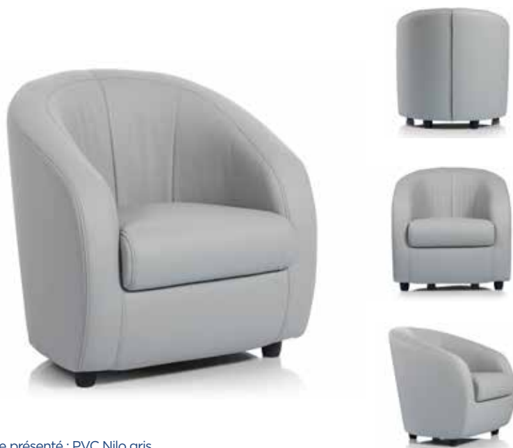
Modèle présenté : PVC Nilo gris