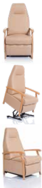
Modèle présenté : PVC Ginkgo dune