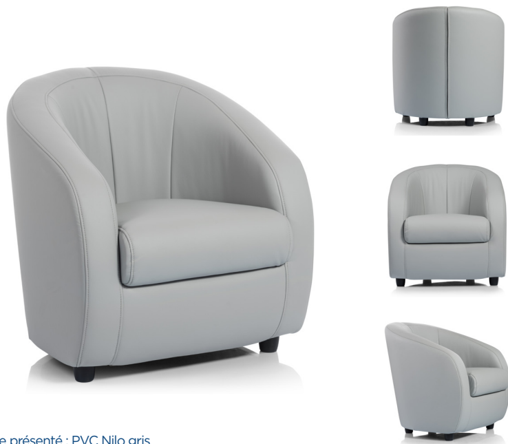
Modèle présenté : PVC Nilo gris