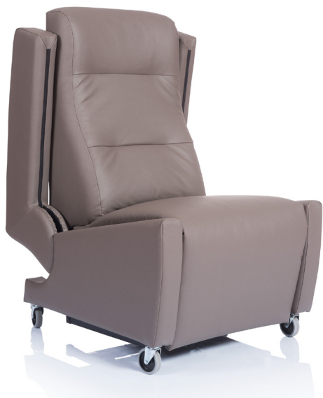
Modèle présenté : PVC Ginkgo souris

L'alliance du confort et de la praticité