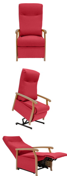
Modèle présenté : Grain rojo